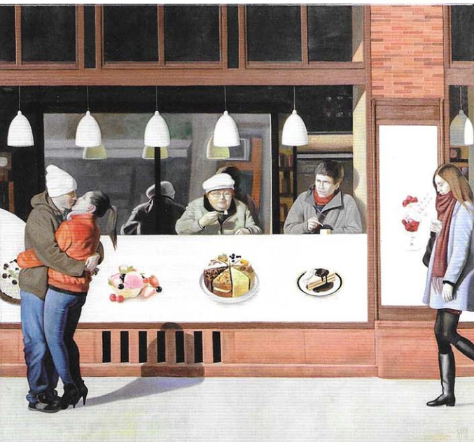
gy kis édesség

– Az anyaság nagyon mély transzformáció, különösen introvertált alkatú, művészettel foglalkozó embernek. Óriási szükségem van az egyedül töltött, befejező forduló időre, ami főleg egy pici baba mellett kevésbé kivitelezhető. Így tudtam, hogy az életben vannak prioritások, mindennek megvan a maga ideje. Tudtam, hogy a kisgyerek mellett nem a fő műveimet fogom megalkotni. Sok festészeti kérdés felmerült bennem, hogy merre tovább. Nagy átalakulások és átrendeződések zajlanak a személyiségemben, és tudom, hogy előbb-utóbb ez a képeimen is vissza fog köszönni. Anyaként is festek, mert ez az a dolog, ami nagyon foglalkoztat és lelkesít, a belső egyensúlyomhoz szükségem van a munkára. Nem tudok annyi időt fordítani a festésre, mint gyermekem születése előtt, amikor még időmilliomos voltam. Így kevesebb kép készül, és lassabban. De mindenképp