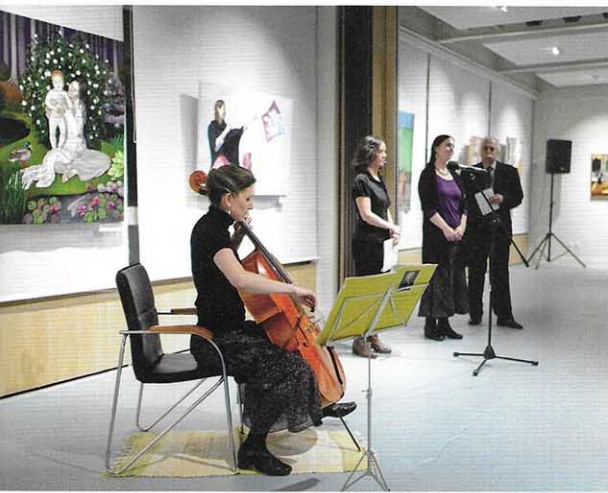
zene a megnyitón