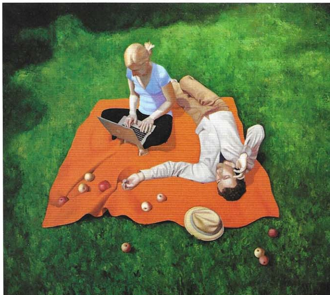
Végre a friss levegőn

– Mind a kettőnek egyszerre. A képek megszületésében nagyon sok az ösztönös rész. Az, ahogy a képekre rátalálok magamban, egyáltalán nem tudatos folyamat.