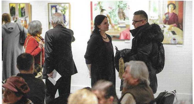
Beszélgetés az ismerősökkel

– Mindkettő. Vannak témák, amelyek foglalkoztatnak, utánajárok, gondolkodom, írok róluk, próbálom képnyelven is megfogalmazni őket. Ugyanakkor festőként figyelemmel járok a világban, szeretek megfigyelni, rácsodálkozni, és egy-egy látvány, valami szép vagy valami rút is nagyon be tudja indítani a fantáziám. Az inspirációnak rengeteg forrása van. ■